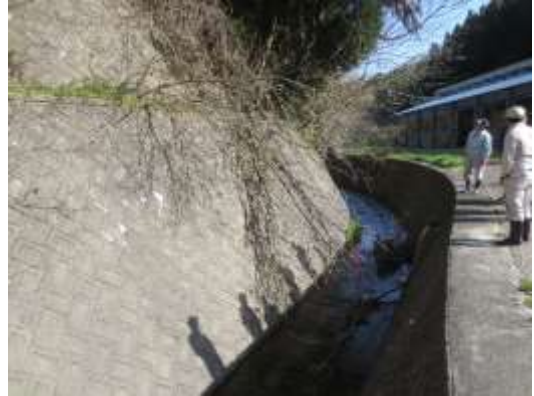
カントリーの水路に雑木が2本