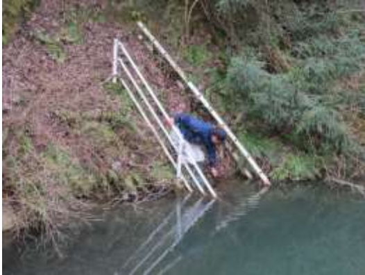
水ヶ谷の溜池は異常なし。