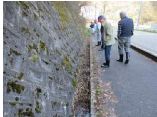
カントリー～谷地水路は江ざらいの必要あり。