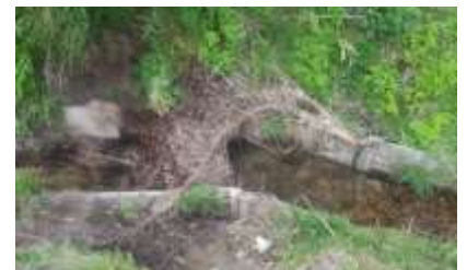
滝の谷内の排水路に雑木。