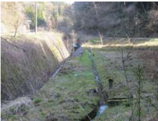
田代の用水は詰まりなし。